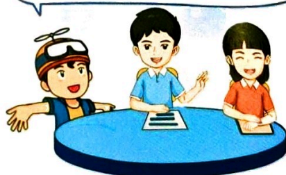
图 1.1.5 项目结尾总结