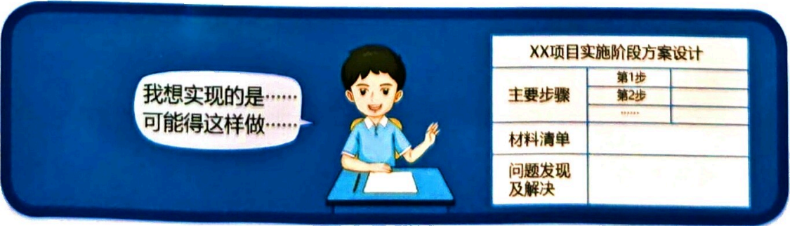
图 1.1.4 项目实施计划

在此阶段，将分解项目目标，预测项目的大致工作步骤和所需资源，并思考实现每个步骤所需的时间和大致方法等，如图 1.1.4 所示。