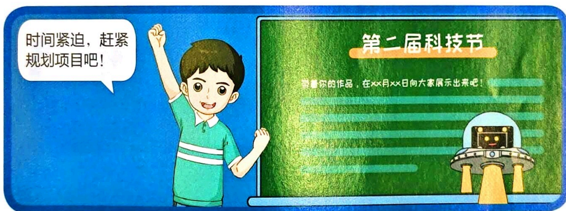
图 1.1.1 确定项目主题

项目是指人们在一定的资源和时间范围内完成的一项任务。大到完成航空航天活动、探索宇宙，小到制订旅行计划、绘制主题班画，都可以看作项目。实施修路工程、组织春游、制作手工作品等也都可以看作是一个个项目。进行项目之前，我们要先确定项目主题，如图 1.1.1 所示。